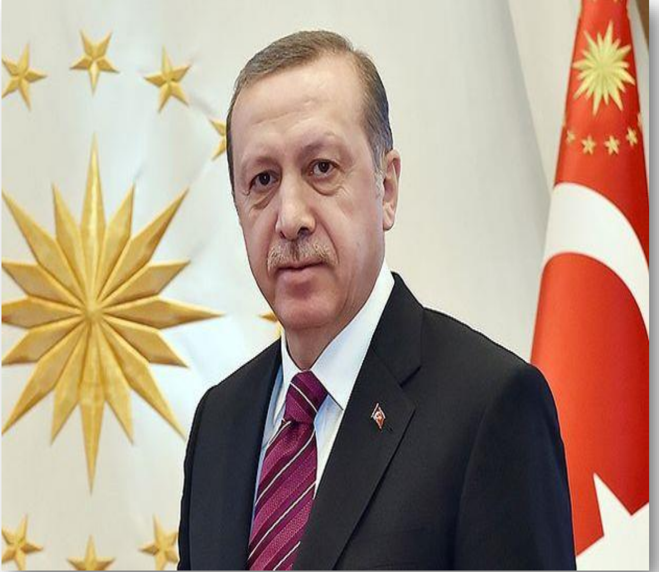
RECEP TAYYİP ERDOĞAN